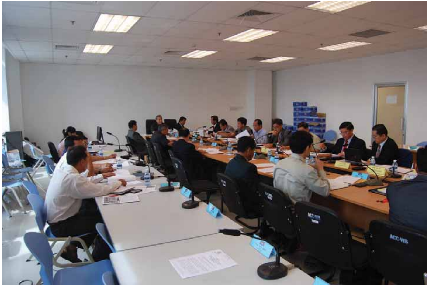
រូបភាពនៃកិច្ចប្រជុំលើកទី ១ របស់ក្រុមប្រឹក្សាសេដ្ឋកិច្ច សង្គមកិច្ច និងវប្បធម៌ (ក.ស.វ.)