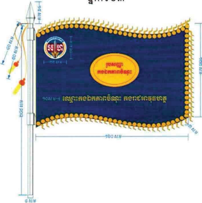
ផ្នែកទី០៣