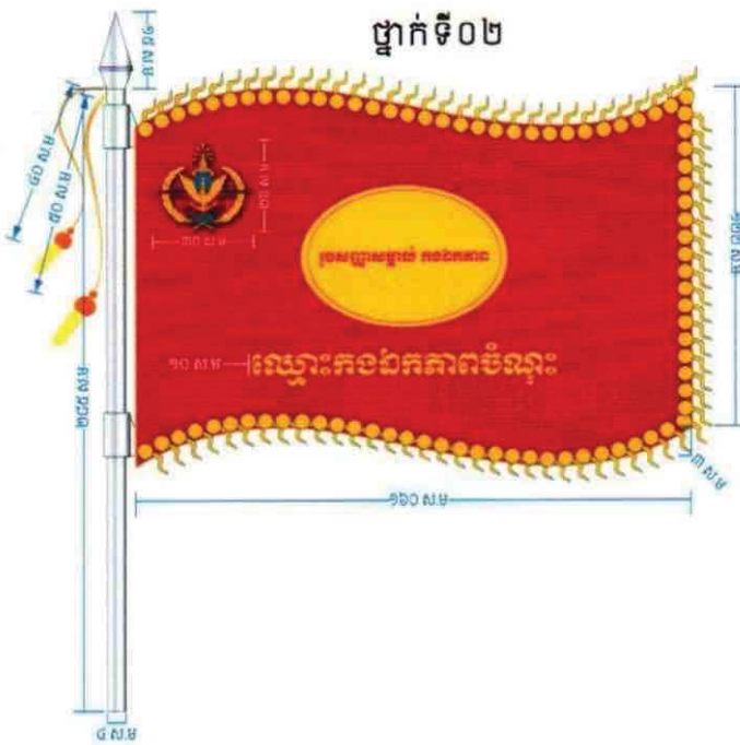
ផ្នែកទី០២