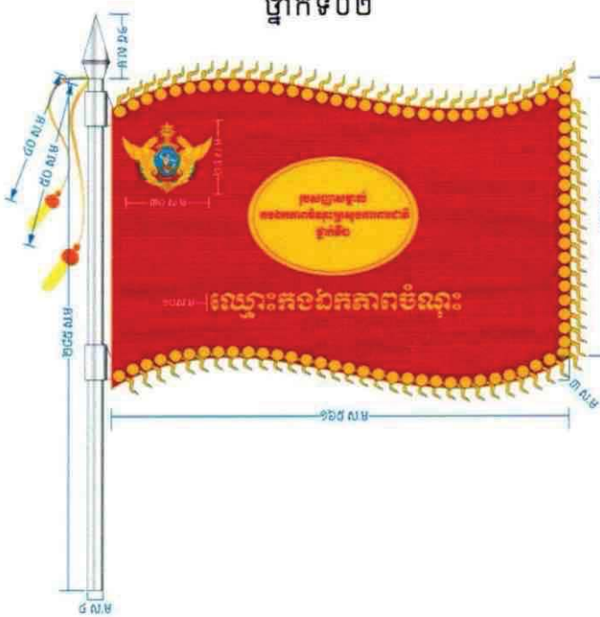
ថ្នាក់ទី០២