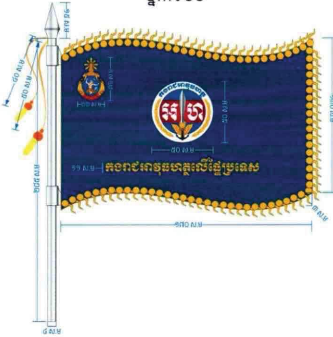
ផ្នែកទី០១