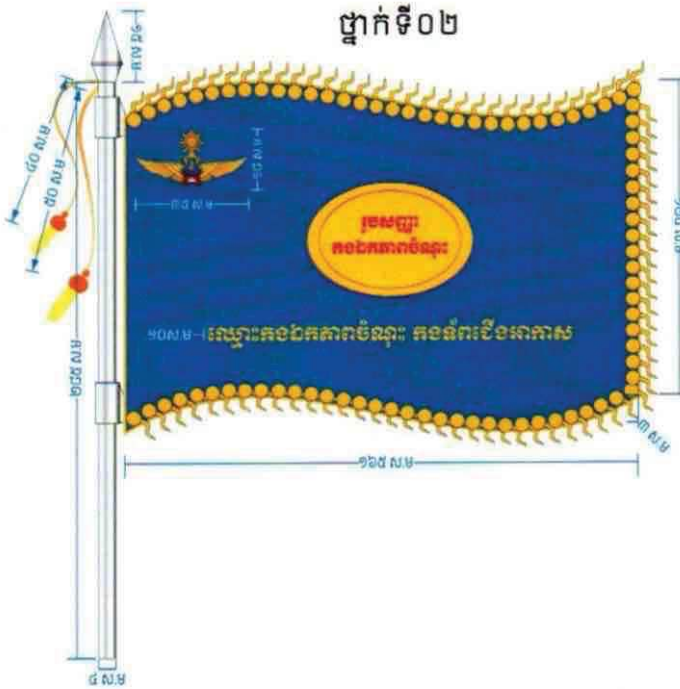
ថ្នាក់ទី០២