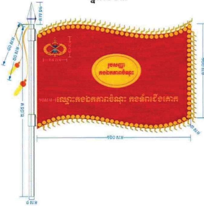
ផ្ទាំងទី០៣