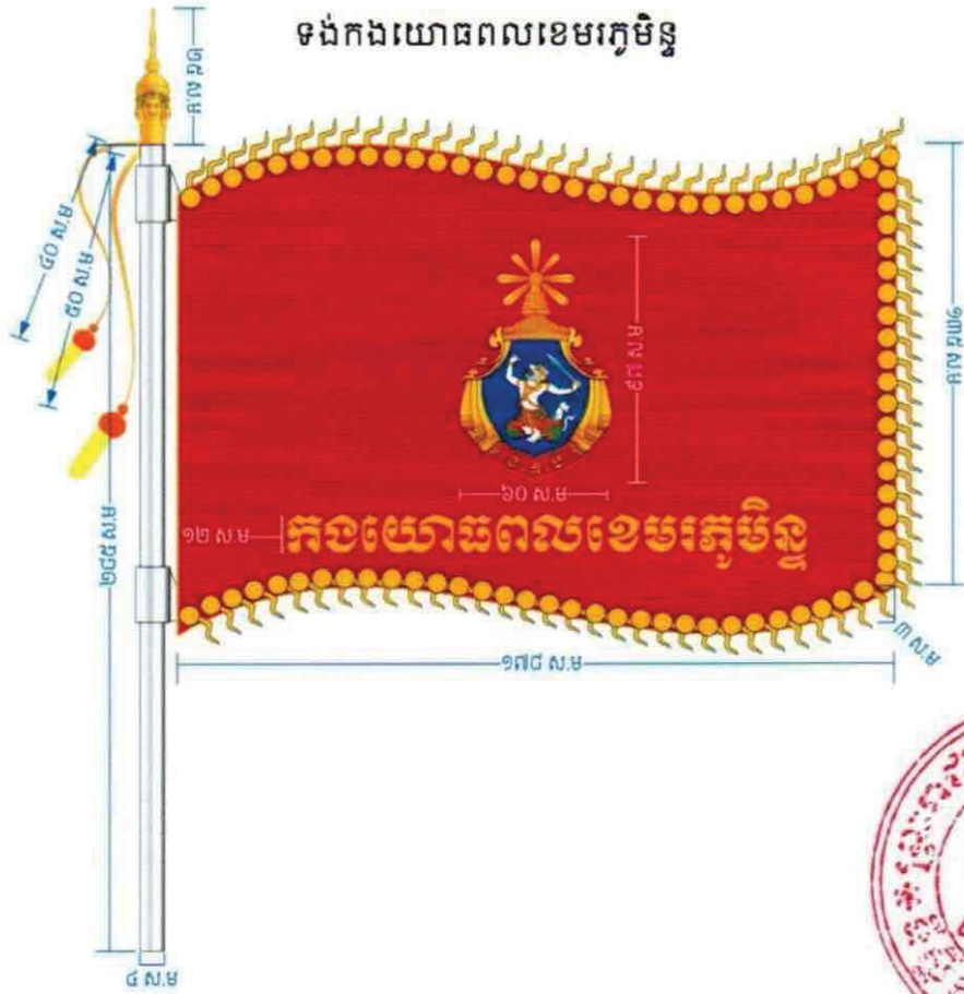
ទង់កងយោធពលខេមរភូមិន្ទ