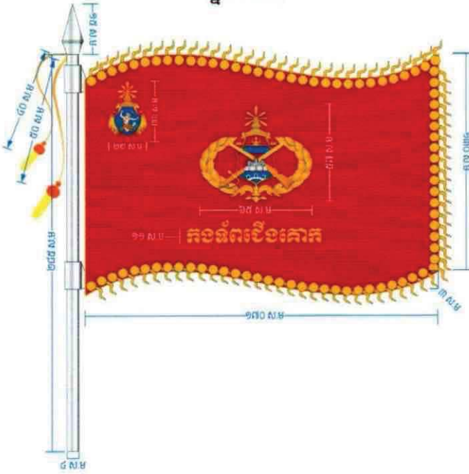
ផ្ទាំងទី០១