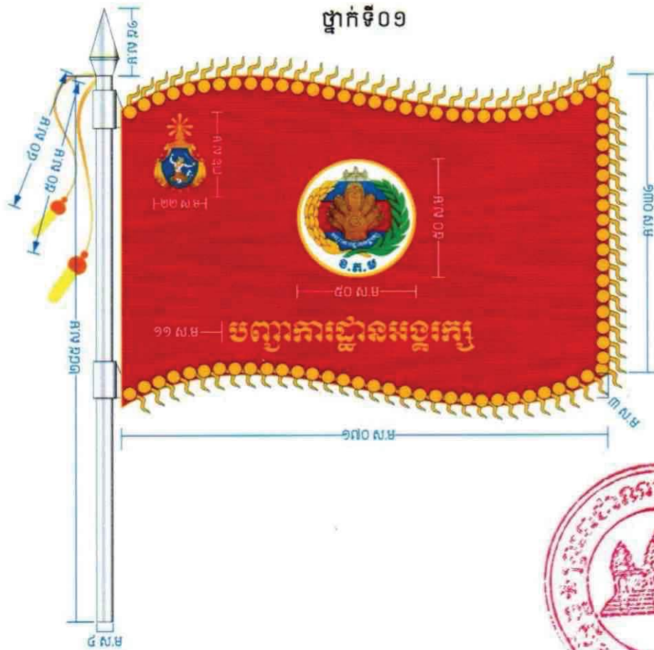
ថ្នាក់ទី០១