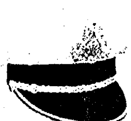
៤. មន្ត្រីបច្ចេកទេស