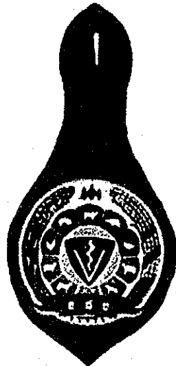
ស្នាគសញ្ញាសំគាល់សម្រាប់តម្កល់លើកំរាបបោះឆ្នោតស្ត្រី