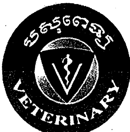
ស្នាគសញ្ញាសំគាល់សម្រាប់ដាក់លើម៉ែដៃនាយកស្ត្រី