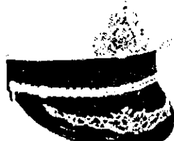
២. ថ្នាក់ការិយាល័យ