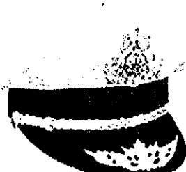
៣. ប្រធានស្នាក់ការ