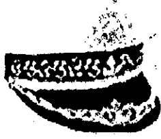
១. ថ្នាក់នាយកដ្ឋាន