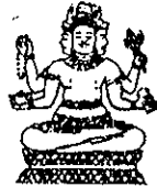
ក្រុមប្រឹក្សាធម្មនុញ្ញ